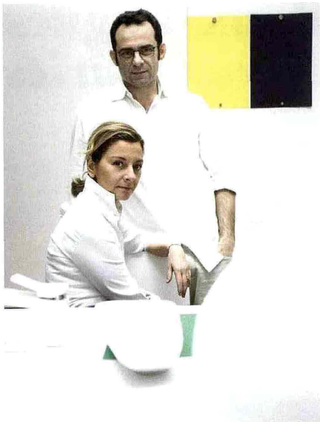
053 Loto ZANOTTA